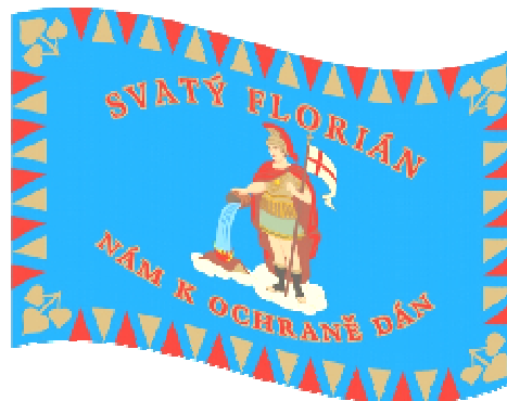
Prapor hasičů (z obou stran)